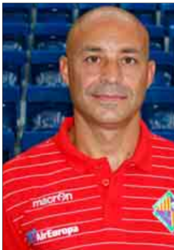
Juanito. EL MUNDO

Antes, este viernes (20.30 horas), el Palma Futsal recibe en el Palau Municipal d'Esports de Son Moix al Uruguay Tenerife, un equipo ya descendido y que ha podido llegar al final de la campaña