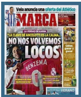
Las Portadas de los Periódicos

FANTASMAS BIKERS Ruta 5 Villas Fantasmas-bikers 2014 - Ya falta poco para la V edición de nuestra tradicional ruta