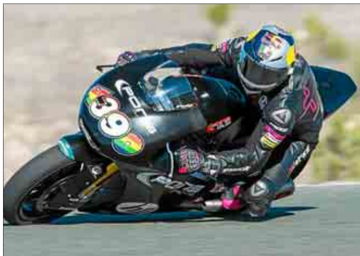
Salom, durante un instante de los entrenamientos en Almería.

El mallorquín añadía posteriormente: «Me voy contento al primer IRTA del año, la verdad es que el equipo me está ayudando mucho y me están apoyando bastante para mejorar cada vez que salgo a pista».