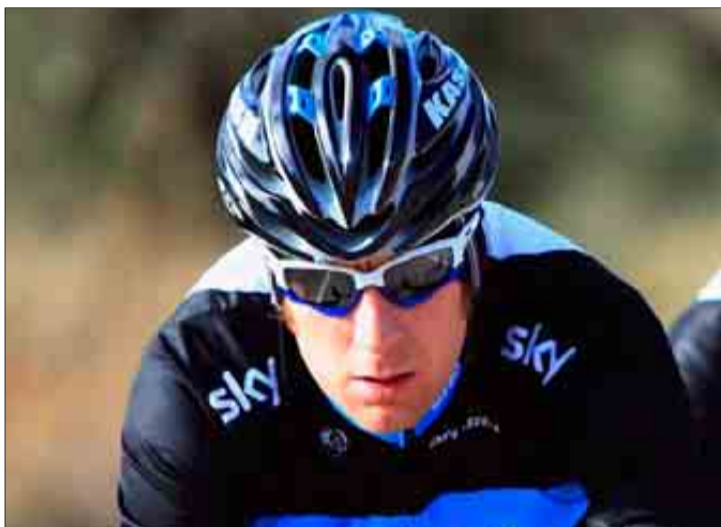
Bradley Wiggins, durante una prueba con el Team Sky

En el tercer trofeo entrarán en escena los escaladores más puros en una etapa de 150 kilómetros en la que los ciclistas subirán cinco puertos: dos de tercera, dos de segunda y un primera, el Coll del Puig Mayor, que se corona a 18,7