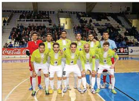
▲ Estreno en el Palau. El Hospital de Llevant se impuso 5-1 a la selección balear en la semifinal del II Torneo Air Europa-disputado en el Palau d'Esports.