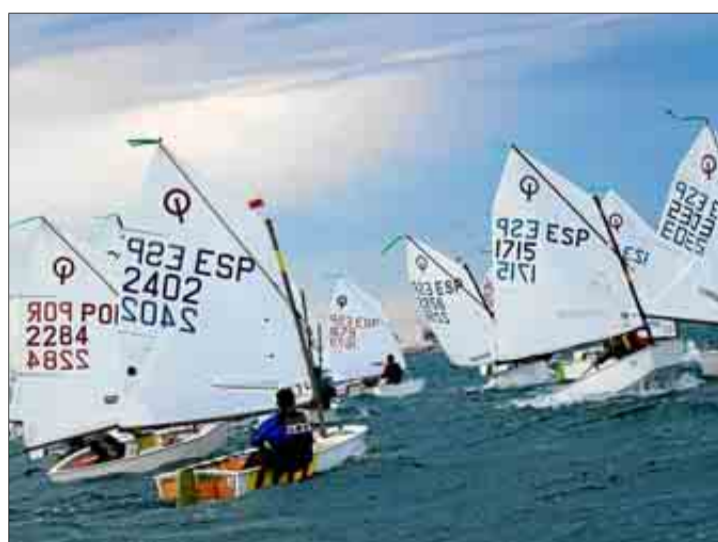
Una imagen de la regata disputada ayer.

La jornada arrancaba muy temprano y con un parte que no iba a ser el mejor aliado. Sobre las 9.15 horas la flota se hacía al agua y sobre las 10.30 se daba la primera salida con un viento que oscilaba entre los 22-24 nudos de intensidad con rachas que llegaban a superar los 30 nudos de intensidad. Al llegar a la tercera prueba del día esos 30 nudos de intensidad eran constan-